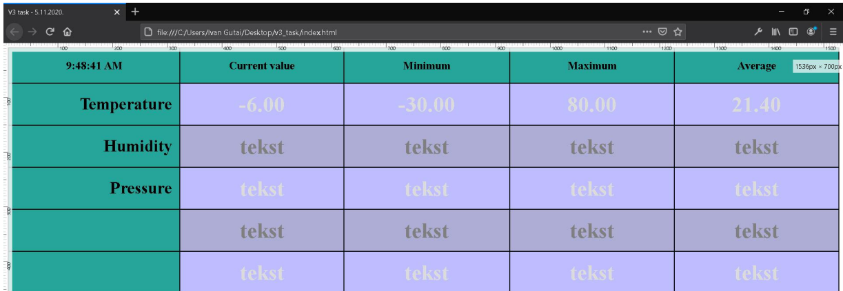
Slika 1. Prikaz na višoj rezoluciji

Dodatno: Kreirati funkciju koja svake sekunde menja vrednosti u poljima u tabeli, za svaku veličinu posebno. Podatke, osim trenutne vrednosti je potrebno učitati iz niza brojeva.